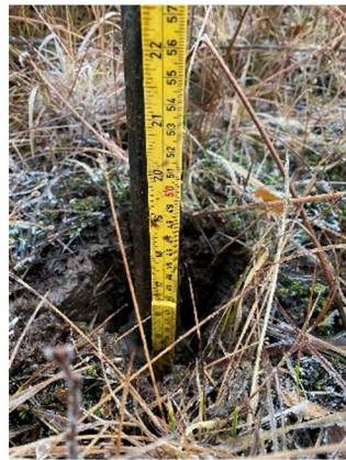
Prøvehol 400 mm til fjell

For å sjekka om der finns grunn som må definerast som myr i planområdet har ein utført ei rekkje prøvehol med sonde mot fjell/ fast grunn. I dei våte områda fann ein fjell i djupne på mellom 400 millimeter og 700 millimeter. Der var ingen teikn til torvmasse i nokon av prøvehola. I alle prøvane var det observert siltig jord.