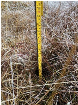
Prøvehol 700 mm til fjell